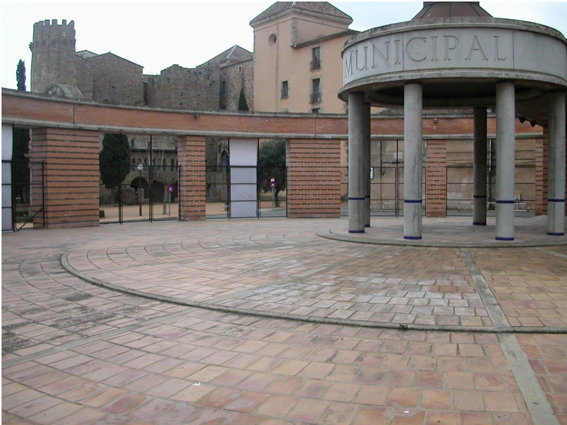
Fotografia de la façana del Teatre Auditori Municipal Narcís Masferrer.