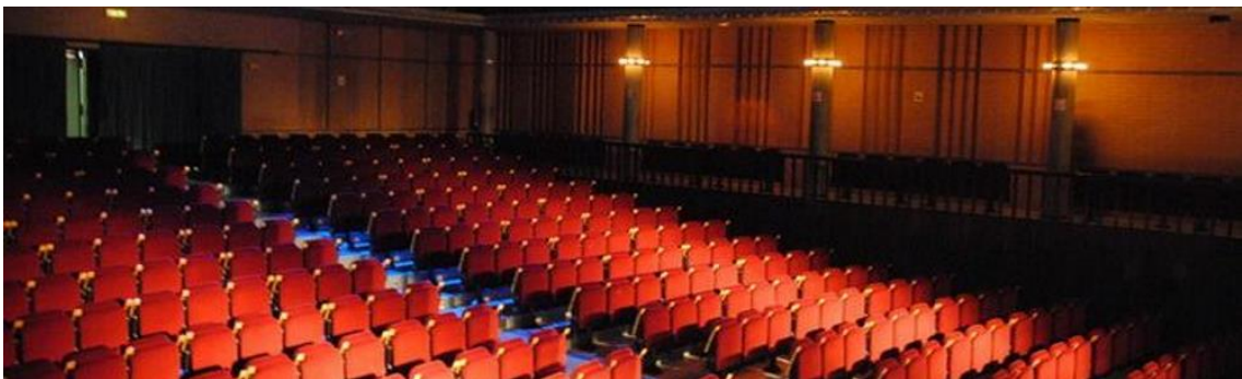
Fotografia de la sala del Teatre Auditori Municipal Narcís Masferrer.