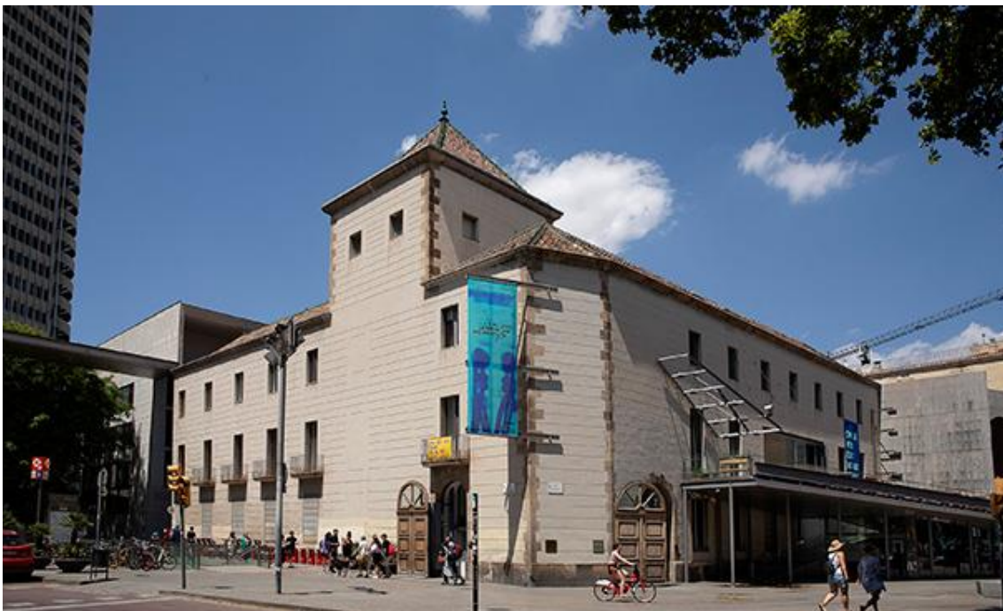
Fotografia exterior del Centre d'Arts Santa Mònica