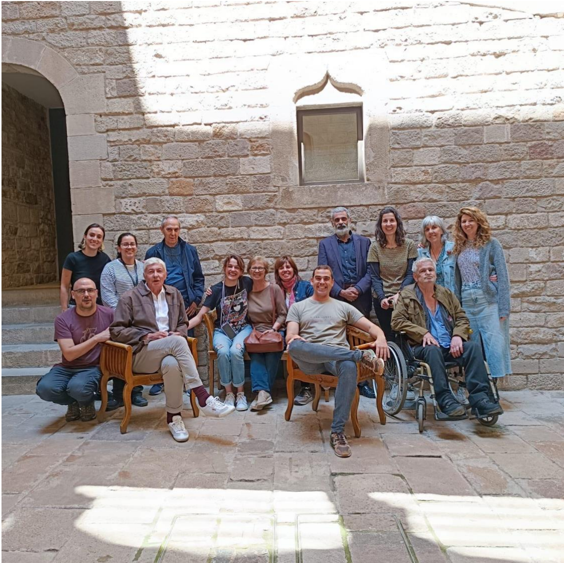
Participantes y organizadoras del Grupo de Discusión Sinhogarismo y Cultura en su última sesión en el Museo Etnológico y de las Culturas del Mundo

En resumen, este trabajo plantea una serie de ideas y propuestas que buscan superar las barreras físicas y simbólicas, así como reconceptualizar el significado de las nuevas luchas políticas de los movimientos sociales y ciudadanos (Tirado, 2009) en los equipamientos culturales y garantizar un acceso inclusivo, acogedor y transformador para las personas en situación de sin hogar.