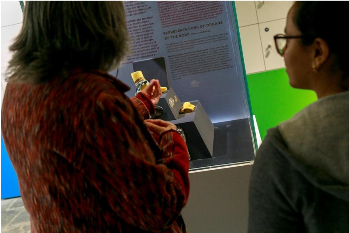
Participantes del grupo de discusión disfrutando del Museo Etnológico y de las Culturas del Mundo