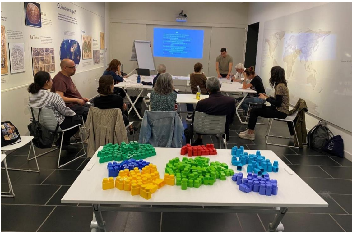
En la tercera sesión construimos nuestro equipamiento cultural ideal