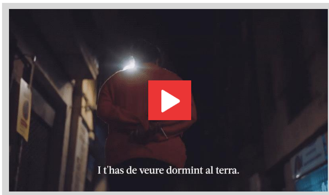
Vídeo de la campaña El hogar de todas de Acerca Cultura

En los primeros meses de este período, se identificó la necesidad de combatir los estigmas y prejuicios que rodean al Sinhogarismo. Como respuesta a esta necesidad, se realizaron formaciones en Barcelona, Lérida, Tarragona y Gerona dirigidas a los profesionales de los equipamientos culturales. Al mismo tiempo, se puso en marcha una campaña de comunicación de sensibilización y se organizaron encuentros para generar conocimiento colectivo, como las Jornadas de Accesibilidad y Diversidad (Sinhogarismo y Cultura) que se celebraron en el MACBA en febrero de 2023, así como proyecciones de películas y cortometrajes en el CCCB y en el Palau de la Música.