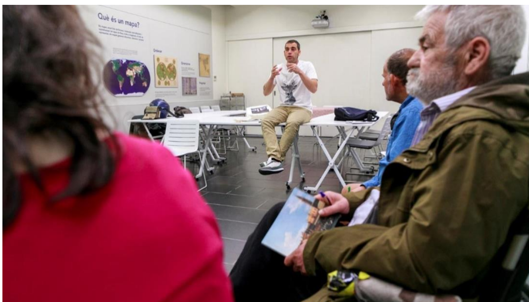
Primera sesión del grupo de discusión.

Han participado en este proceso 16 personas entre participantes y profesionales, de entidades como Cáritas, Asís y Arrels.