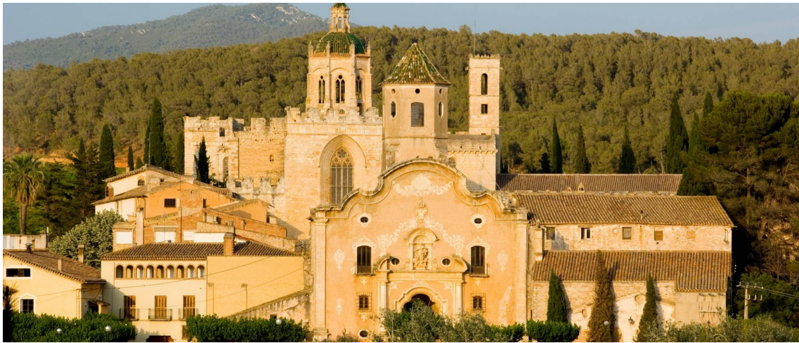
Imatge exterior i paisatge del conjunt del Reial Monestir de Santes Creus