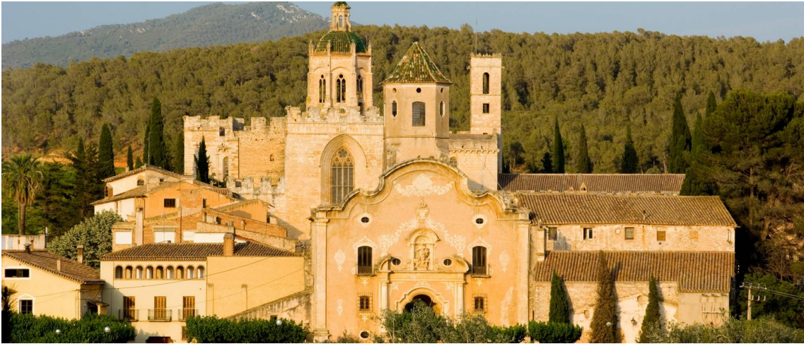
Imagen exterior y paisaje del conjunto del Real Monasterio de Santes Creus